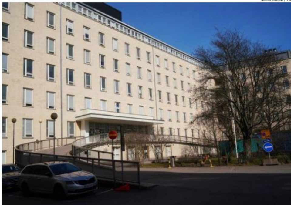
Suurin osa helsinkiläisistä synnyttää Naistenlinnikalla Meilahdessa.

Myös työuupumus on kätilön mukaan lisääntynyt.